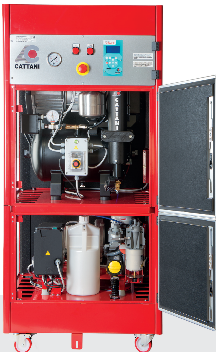
BLOK-JET SILENT 1

GLI ARMADI CHE ARREDANO LO STUDIO DENTISTICO CON STILE ED ELEGANZA.