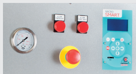
PANNELLO DI CONTROLLO CONTROL PANEL AND DISPLAY PANNEAU DE CONTROLE STEUERTAFEL PANEL DE CONTROL