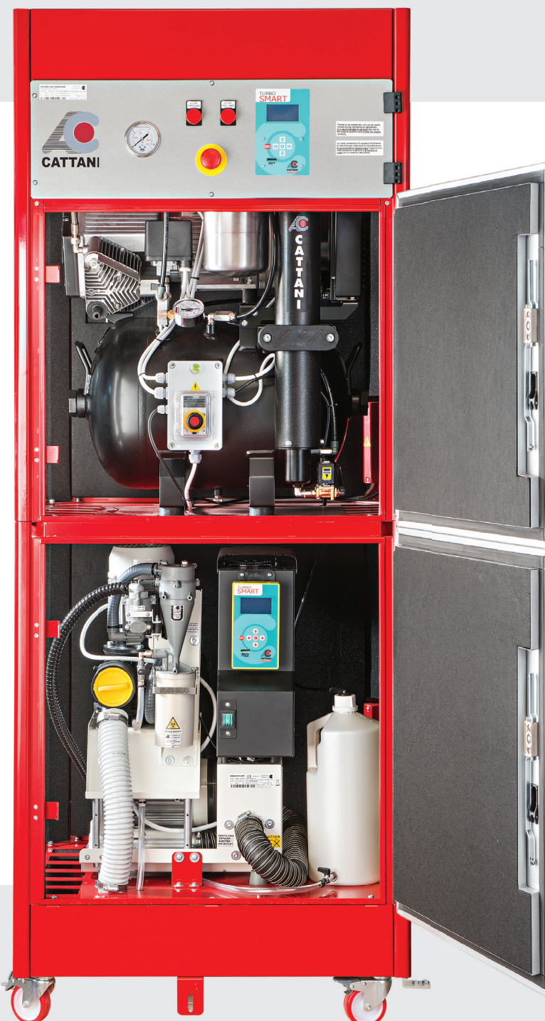
BLOK-JET SILENT 2