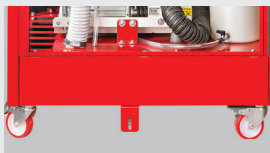
RUOTE DI MOVIMENTAZIONE LOCKABLE WHEELS ROULETTES RÄDER RUEDAS

ASPIRATORE TURBO-SMART VERSIONE B - MOTORE: POTENZA RESA 1,5 KW - 9 A PREVALENZA MASSIMA PER IL SERVIZIO CONTINUO 2000 MM H2O - PORTATA MAX. 1700 L/MIN. AC300 - COMPRESSORE A TRE CILINDRI COMPLETO DI ESSICCATORE ARIA MOTORE MONOFASE: POTENZA RESA 1,5 KW - 10,2 A - MOTORE TRIFASE: POTENZA RESA 1,5 KW - 3,7 A SERBATOIO ARIA 45 L - ARIA RESA CON MANDATA A 5 BAR EFFETTIVI 238 N L/MIN. LIVELLO DI PRESSIONE SONORA: 55 DB(A) MISURE IN MM L = 757 P = 607 H = 1936 PESO NETTO 280 KG